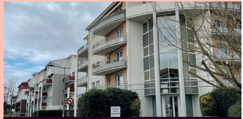
ENTRÉE DU RESTAURANT « LES FAUVETTES »

Le secrétariat du service animation seniors est établi au restaurant des Fauvettes. Vous pourrez y rencontrer les animateurs pour toutes vos demandes : inscriptions, renseignements, assurer le suivi de toutes les activités proposées, vous renseigner et répondre à vos questions.