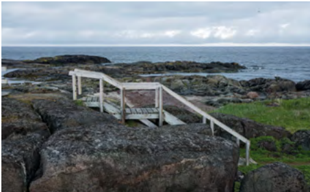
©Saddle Island de Christophe Goussard, issue de l'expositon Fleuves.