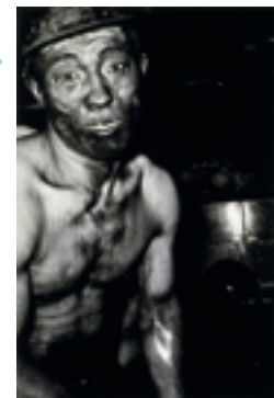
Collection Maison Européenne de la Photographie, Paris / © IKKO NARAHARA

Cette collection s'inscrit dans le cadre de l'évènement « Mérignac Photo » se fait en collaboration avec la Maison Européenne de la Photographie de Paris. Elle présente les œuvres du photographe japonais Ikko Narahara. Son œuvre riche et diversifiée et sa vision décalée sur ce qui l'entoure a concouru à faire évoluer la pratique photographique. Cette rencontre artistique dépassera les murs de la Vieille Eglise et se déploiera dans l'espace public avec l'exposition Territoires de fictions par Benjamin Juhel.