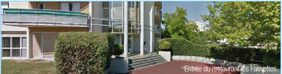
Entrée du restaurant Les Fauvettes.

Nous restons à votre écoute en essayant d'améliorer ce qui peut l'être et vous souhaitons une très belle année 2020.